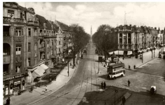
1935 Blick auf den Walter-Schreiber-Platz. Links im Bild das Eckhaus Bornstr. 1 / Schloßstraße

Offenbar ermöglichte die Beförderung der Familie den Umzug in eine Vier-Zimmerwohnung Bornstraße 1, Aufgang II in Friedenau. Das repräsentative Wohn- und Geschäftsgebäude zog sich als großes Eckhaus von der Bornstr. 1 über die Schlossstraße bis zum Walter-Schreiber-Platz. Im Zweiten Weltkrieg wurde es zerstört, die Ruine später abgetragen und auf dem alten Grundriss ein modernes Kaufhaus (damals Hertie) errichtet. Das Grundstück Bornstr. 1 wurde als Einfahrt zum Parkhaus genutzt.